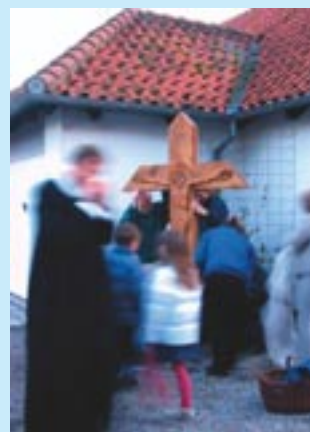
Langfredag blev Jesus korsfæstet

og viste at døden magt i vores liv er brudt. Døden er ikke den sidste fjende, men at vi også der møder Guds nærvær.