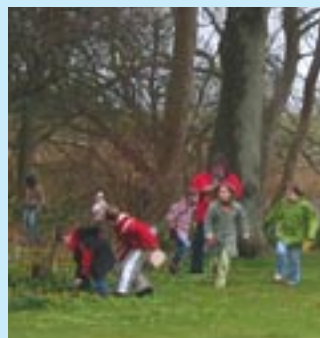
Æggejagt i Præstegårdshaven.

Palmesøndag: Gudstjeneste for børn og barnlige sjæle 1. april kl. 10. 30. Efter gudstjenesten er der æggejagt i præstegårdshaven.